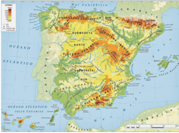
Fig. 14: Mapa físico de España.

• Meseta: es una extensa llanura situada en el centro de la península ibérica, con una altura media de unos 700 m sobre el nivel del mar, dividida por el Sistema Central.