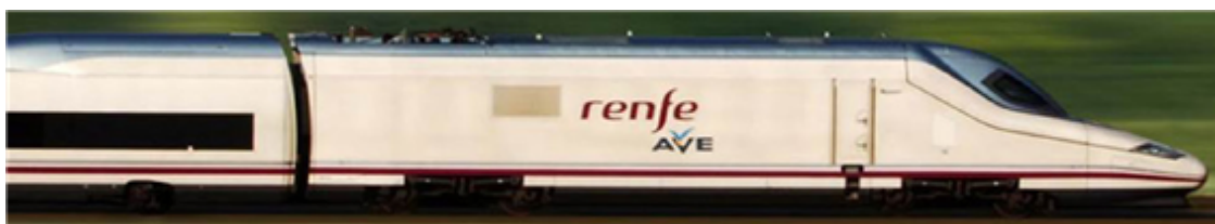
Fig. 46: AVE, tren de alta velocidad española