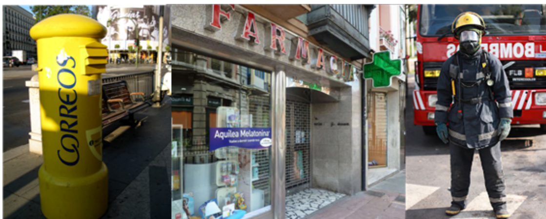
Fig. 41: Imágenes de un buzón de Correos, de una farmacia y de un bombero.