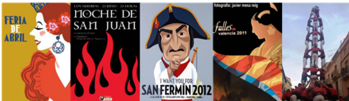
Fig. 25: carteles de fiestas tradicionales de España de repercusión internacional

Por otro lado, el toreo o corridas de toros es un espectáculo que nació en el siglo XII. Se trata de la fiesta en la que se lidian toros bravos a pie o a caballo en un lugar denominado «plaza de toros». También se practica el toreo en Portugal, en el sur de Francia y en diversos países de Hispanoamérica como Colombia, Costa Rica, Ecuador o México.