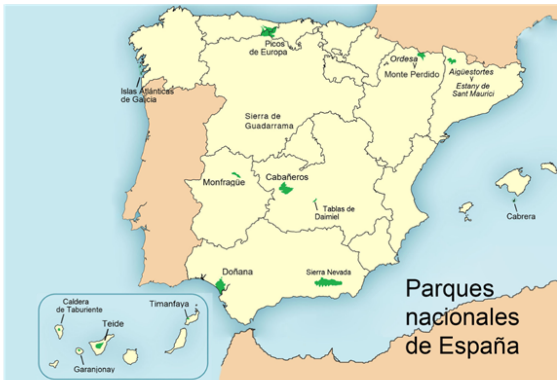
Fig. 15: Parques nacionales de España.

España fue uno de los primeros países de Europa en comenzar a proteger la naturaleza; la primera Ley de Parques Nacionales se aprobó en 1916. Tiene 15 parques nacionales; su gestión y protección se hace a través de la Red de Parques Nacionales.