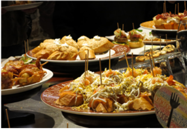
Fig. 31: Barra con pinchos en el País Vasco