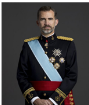
Fig. 4: Felipe VI, Rey de España

El Rey de España es el Jefe del Estado y la Corona es el símbolo de la unidad de España. Tiene la máxima representación del Estado y modera el funcionamiento de las instituciones. Además, entre otras funciones, sanciona y promulga las leyes, nombra a los miembros del Gobierno, a propuesta de su presidente, y tiene el mando supremo de las Fuerzas Armadas de España.