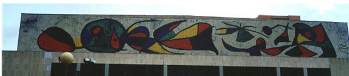
Fig. 21: Mural del Palacio de Congresos de Madrid. Joan Miró.

Además de los museos nacionales del Prado y Reina Sofía, hay otros muy conocidos internacionalmente: el Museo Picasso, en Barcelona; el Museo Thyssen-Bornemisza, en Madrid, y el Museo Guggenheim de Bilbao.