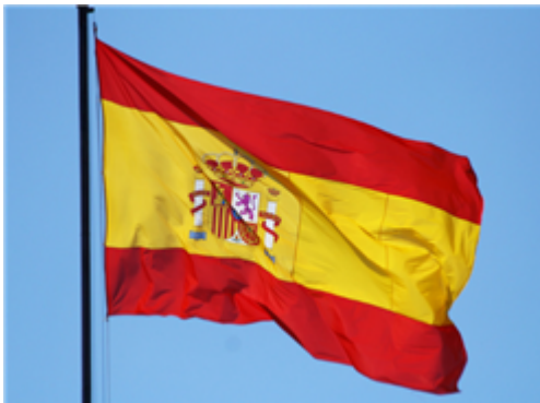
Fig. 2: Bandera de España

La bandera de España tiene tres franjas (roja, amarilla y roja): cada comunidad autónoma tiene su propia bandera y debe utilizarla junto a la española en sus edificios públicos y en sus actos oficiales.