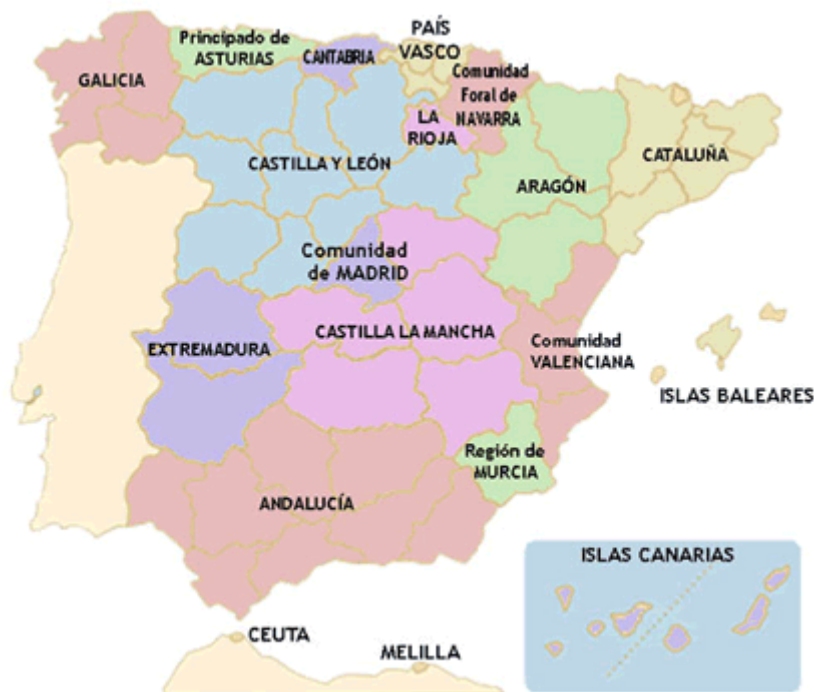
Fig. 16: Mapa político de las comunidades autónomas de España.