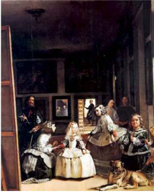
Fig. 19: Las meninas , de Velázquez.

Córdoba (siglos VIII-XIII); el Monasterio y Sitio de El Escorial (Madrid, siglo XVI), y el Parque Güell, el Palacio Güell y la Casa Milà en Barcelona (Barcelona, siglo XX). Posteriormente, se han incorporado la Cueva de Altamira y el arte rupestre paleolítico del norte de España (Asturias, Cantabria y País Vasco); el Acueducto de Segovia y el conjunto arqueológico de Mérida (de época romana); la fachada de la Natividad y la cripta de la Sagrada Familia de Gaudí (Barcelona, siglos XIX-XXI), entre otros.