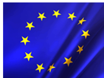
Fig. 5: Bandera de la Unión Europea.

España también forma parte de otras organizaciones internacionales, como la Organización de las Naciones Unidas (ONU); el Consejo de Europa (CE); la Organización del Tratado del Atlántico Norte (OTAN); la Organización para la Cooperación y el Desarrollo Económico (OCDE); la Organización para la Seguridad y la Cooperación en Europa (OSCE). Un lugar especial en las relaciones internacionales de España lo ocupa la Comunidad Iberoamericana de Naciones.