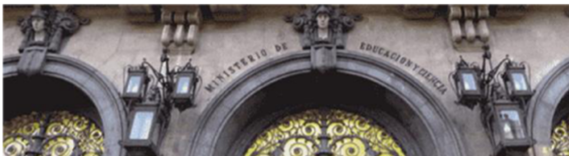
Fig. 33: Ministerio de Educación y Formación Profesional, calle Alcalá, Madrid

La educación es un derecho de los ciudadanos; es obligatoria y gratuita (excepto libros y materiales educativos) desde los 6 hasta los 16 años, lo que se llama educación básica española .