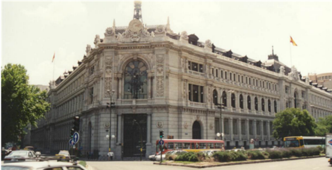
Fig. 48: Banco de España

Tres marcas españolas están entre las cien más valiosas del mundo: Movistar, Grupo Santander y Inditex.